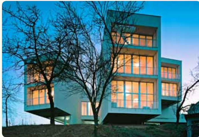
FN kuća u Zagrebu

Kao što se sve mijene u prirodi odvijaju u ciklusima, tako je i u sustav proizvodnje cementa iskorištavanjem komine uključena biomasa, čijom se upotrebom, odnosno korištenjem njene toplinske vrijednosti, na kraju dolazi do građevinskog materijala cijenjenog u Hrvatskoj i u široj regiji, CEMEX-ovog cementa. Upravo su neke građevine koje koriste ovaj cement osvojile prestižnu međunarodnu CEMEX-ovu Graditeljsku nagradu. Kao posebno vrijedne projekte iz prijašnjih godina izdvajamo splitsku Rivu, Skradinski most, FN kuću u Zagrebu te zadarske Morske orgulje.